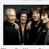
The Rolling Stones