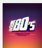
We Love The 80's